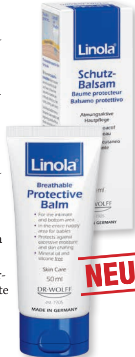
Der atmungsaktive Schutz-Balsam von Linola®