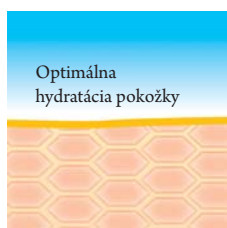
Zdravá pokožka s celistvou ochrannou kožnou bariérou

V dôsledku príliš častého umývania alebo sprchovania sa môžu štruktúrne lipidy strácať alebo sa neobnovujú v dostatočnej miere, ako napr. u atopického ekzému alebo u starmúcej kože. Rohovinové bunky sa od seba oddeľujú a prirodzená ochranná bariéra sa narušuje.