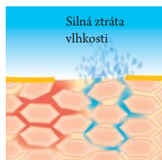
Při nedostatku kyseliny linolové dochází k narušení ochranné kožní bariéry

At jsou příčiny narušení ochranné bariéry vnitřní nebo vnější, následek je vždy stejný – suchá, šupinatá a drsná pokožka, která má silné sklony k zánětům, svědění nebo ekzémům.