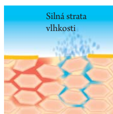
Pri nedostatku kyseliny linolovej dochádza k narušeniu ochrannej kožnej bariéry

Nech sú príčiny narušenia ochrannej bariéry vnútorné alebo vonkajšie, následok je vždy rovnaký – suchá, šupinatá a drsná pokožka, ktorá má silné sklony k zápalom, svrbeniu alebo ekzémom.