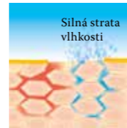
Silná strata vlhkosti