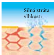
Silná ztráta vlhkosti