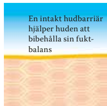
Intakt och skyddande hudbarriär med lipider som är rika på linolsyra.

Besök www.linola.de och välj alternativet "Country" i rullgardinsmenyn. Här hittar du senaste nytt om Linola Hudlotion, Linola Ansikte, Linola Dusch och Tvätt och Linola Skyddande Balsam .