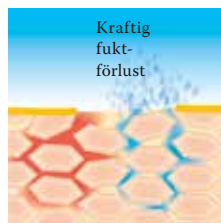
Lipidförlust leder till en försämrad hudbarriär: huden förlorar mycket vatten och torkar ut.